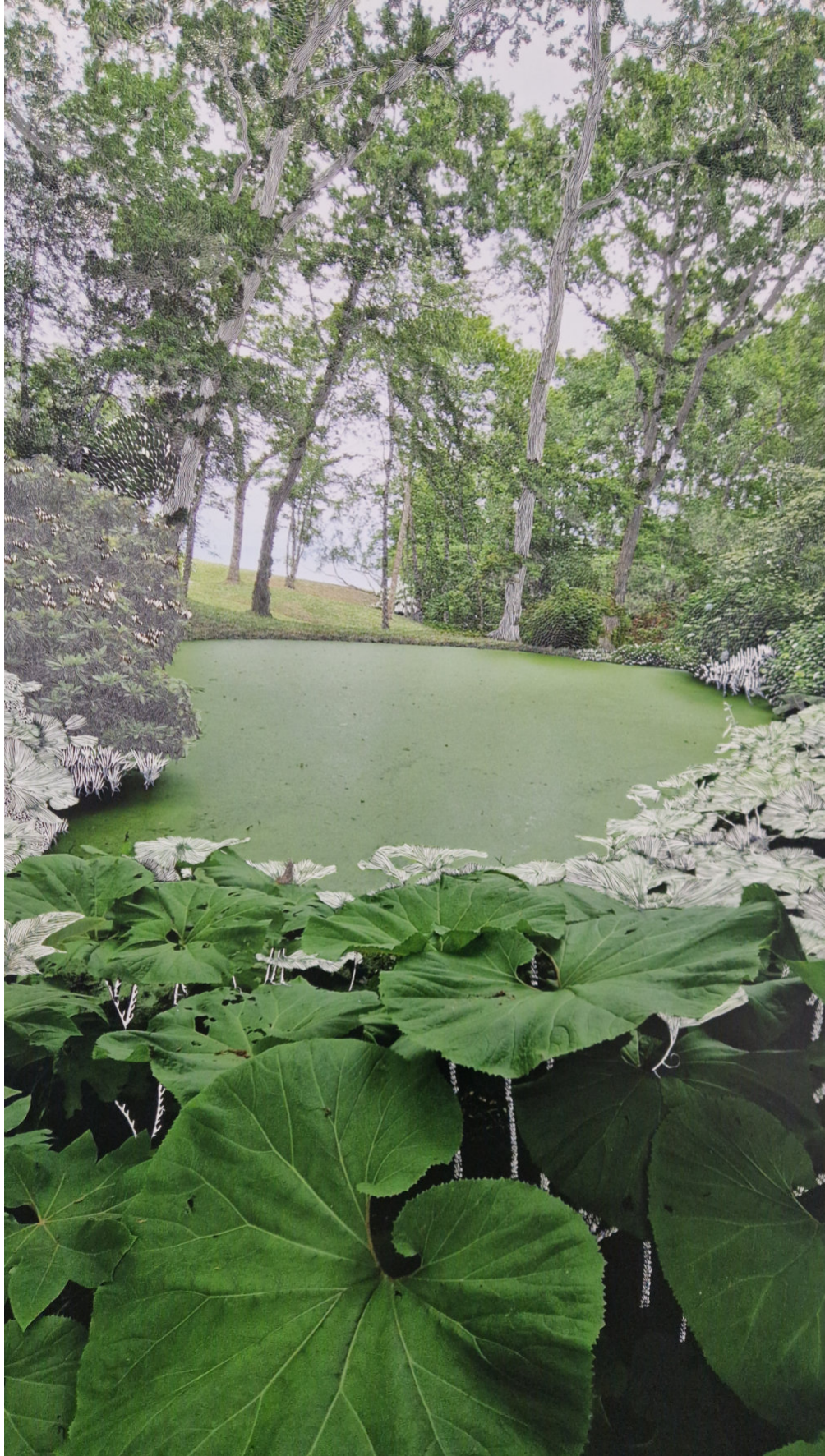
La mare verte, 2025, grattage photographique, 114x76 cm © Raphaëlle Péria / Courtesy Galerie Papillon