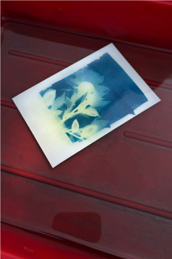
Cyanotype © Stimultania