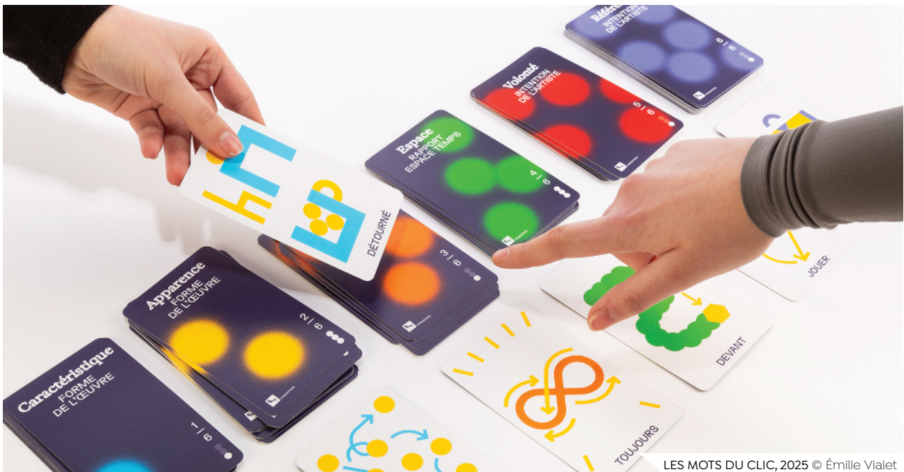
LES MOTS DU CLIC, 2025 © Émilie Vialet