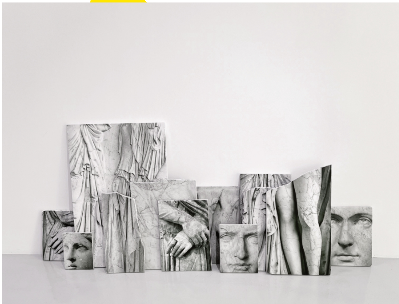
Sculptures, 2024 © Dune Varela