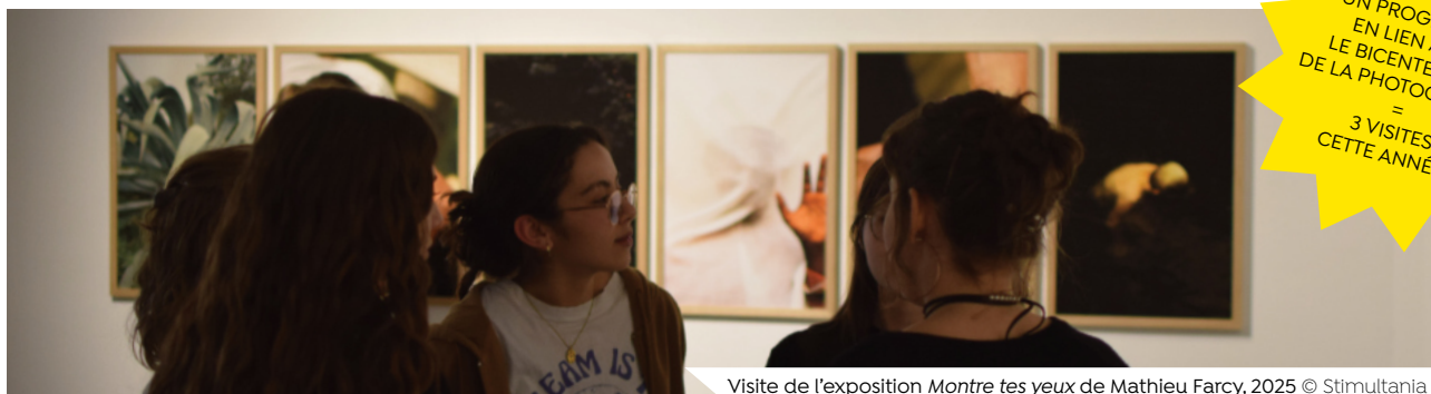
Visite de l'exposition Montre tes yeux de Mathieu Farcy, 2025

UN PROGRAMME EN LIEN AVEC LE BICENTENAIRE DE LA PHOTOGRAPHIE = 3 VISITES CETTE ANNÉE !