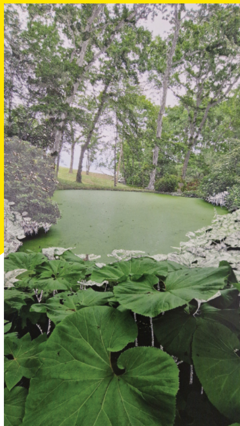
La mare verte, 2025 © Raphaëlle Péria