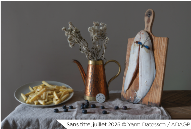
Sans titre, juillet 2025 © Yann Dattessen / ADAGP