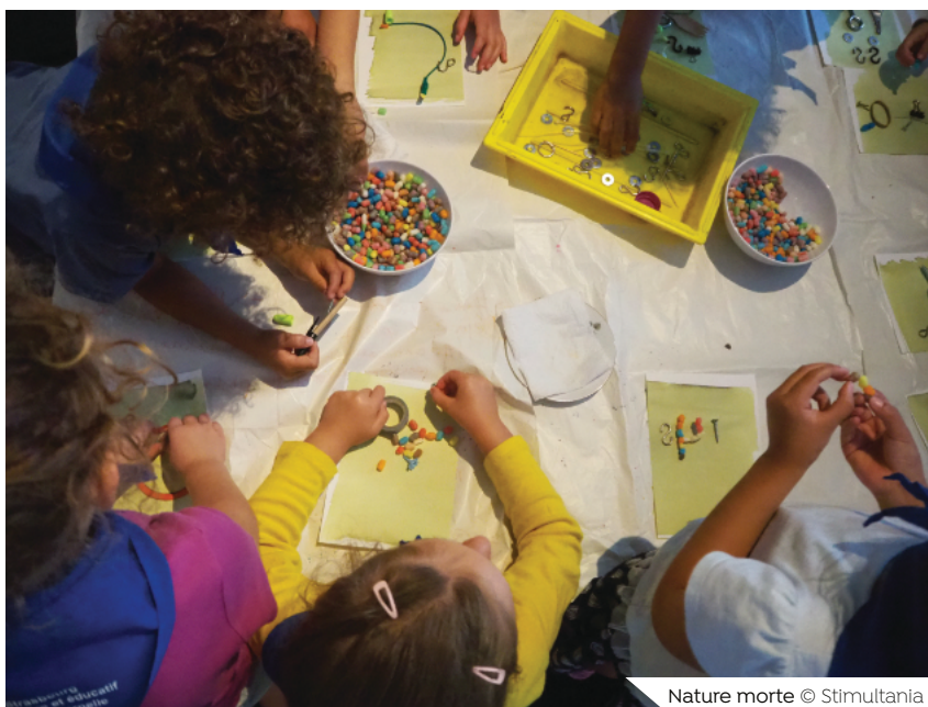
Nature morte

Développer sa créativité & son imaginaire. Expérimenter son interprétation des formes & de l'espace. Composer. Travailler sa prise de parole & son écoute.