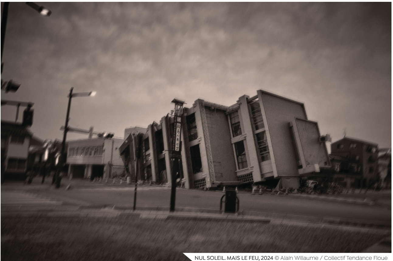
NUL SOLEIL. MAIS LE FEU, 2024