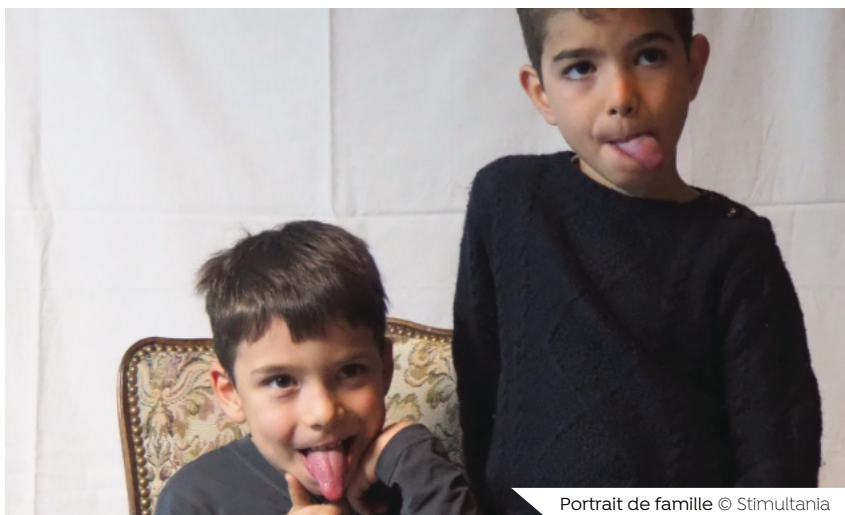
Portrait de famille

Travailler sa confiance et sa légitimité. Expérimenter les notions de représentations. Aborder les notions d'individualité/de collectivité. (Découvrir le flou artistique).