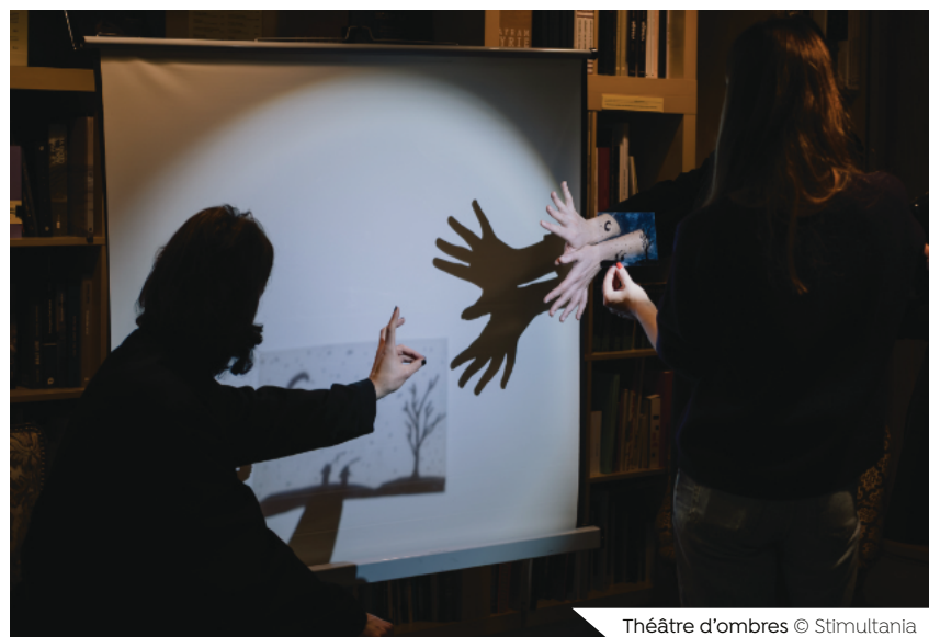
Théâtre d'ombres