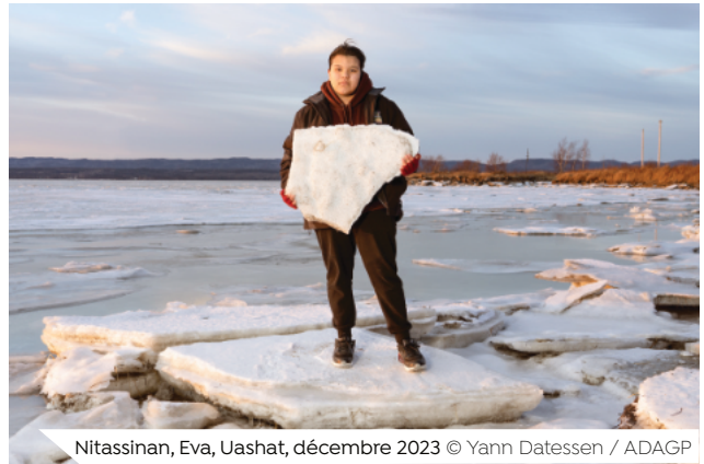
Nitassinan, Eva, Uashat, décembre 2023