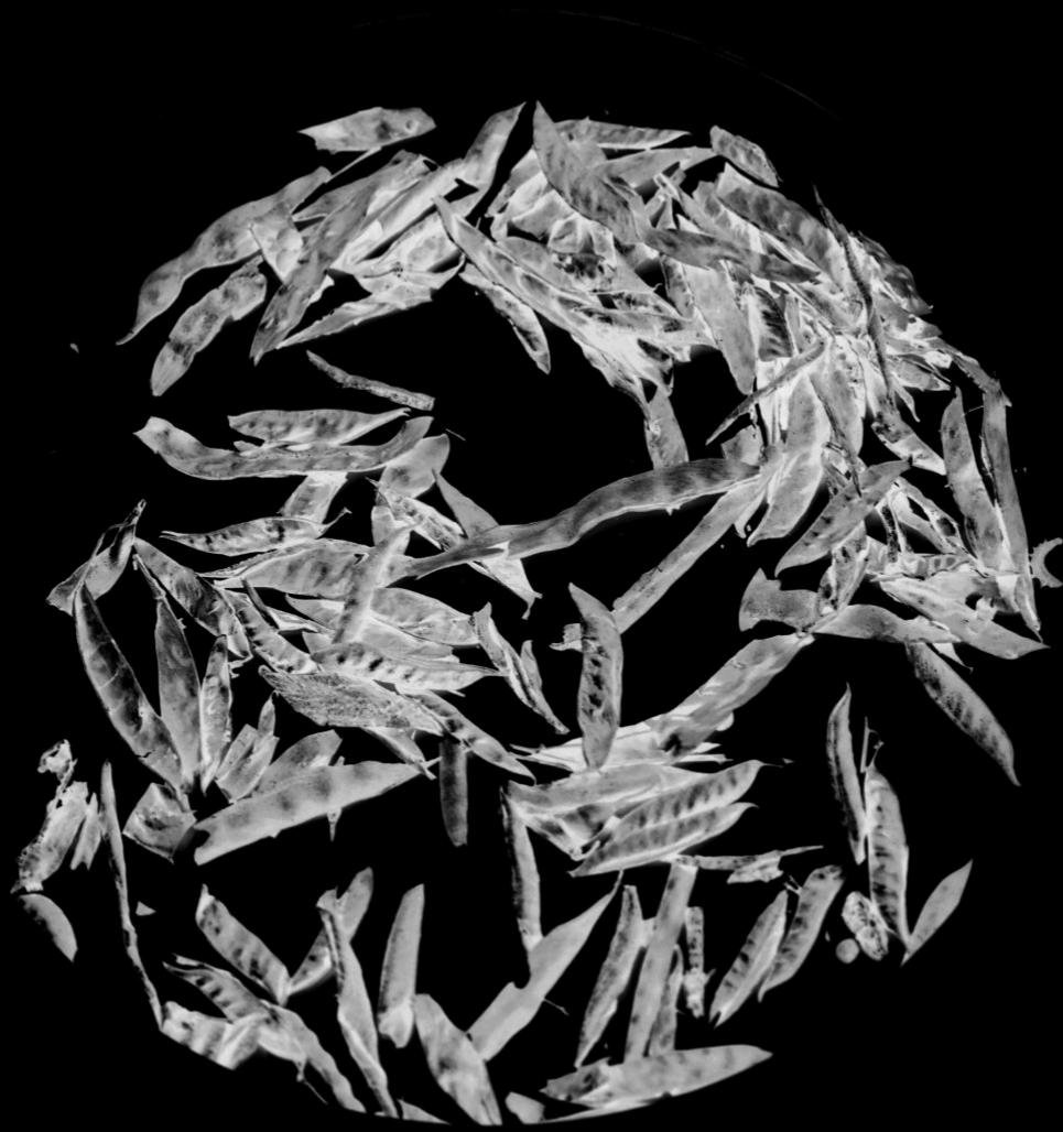
Gousses de légumineuses sauvages, plantes carbonisées durant l'éruption du Vésuve en 79 de notre ère, 2024 © Anaïs Tondeur