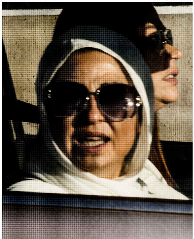
VISUEL 4 Voir , 2020