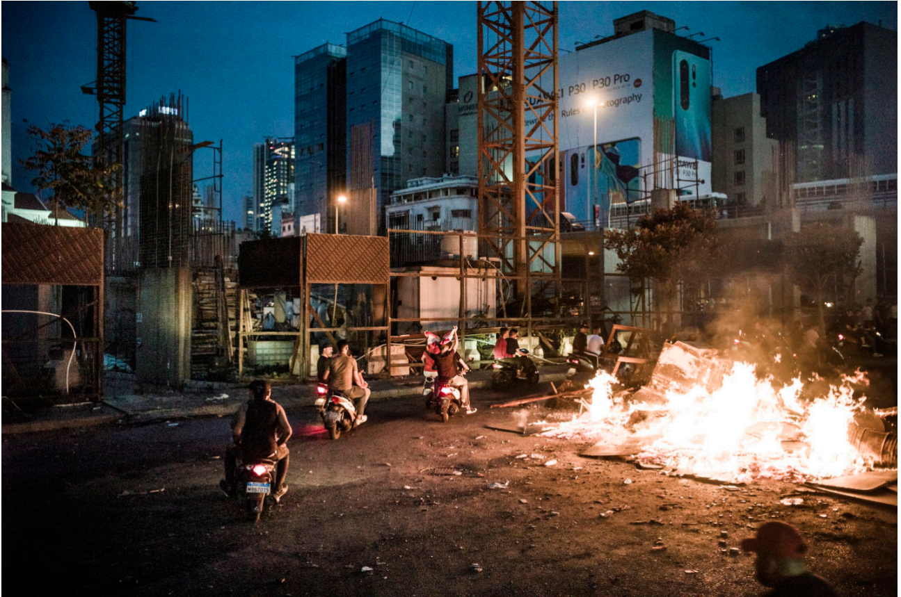
VISUEL 3 Révoltes , 2019