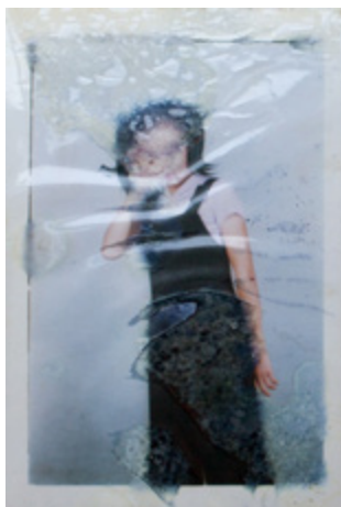
Chinese Chapters (Notes sur la Chine), On gardait les feuilles de lotus fanés pour entendre la pluie