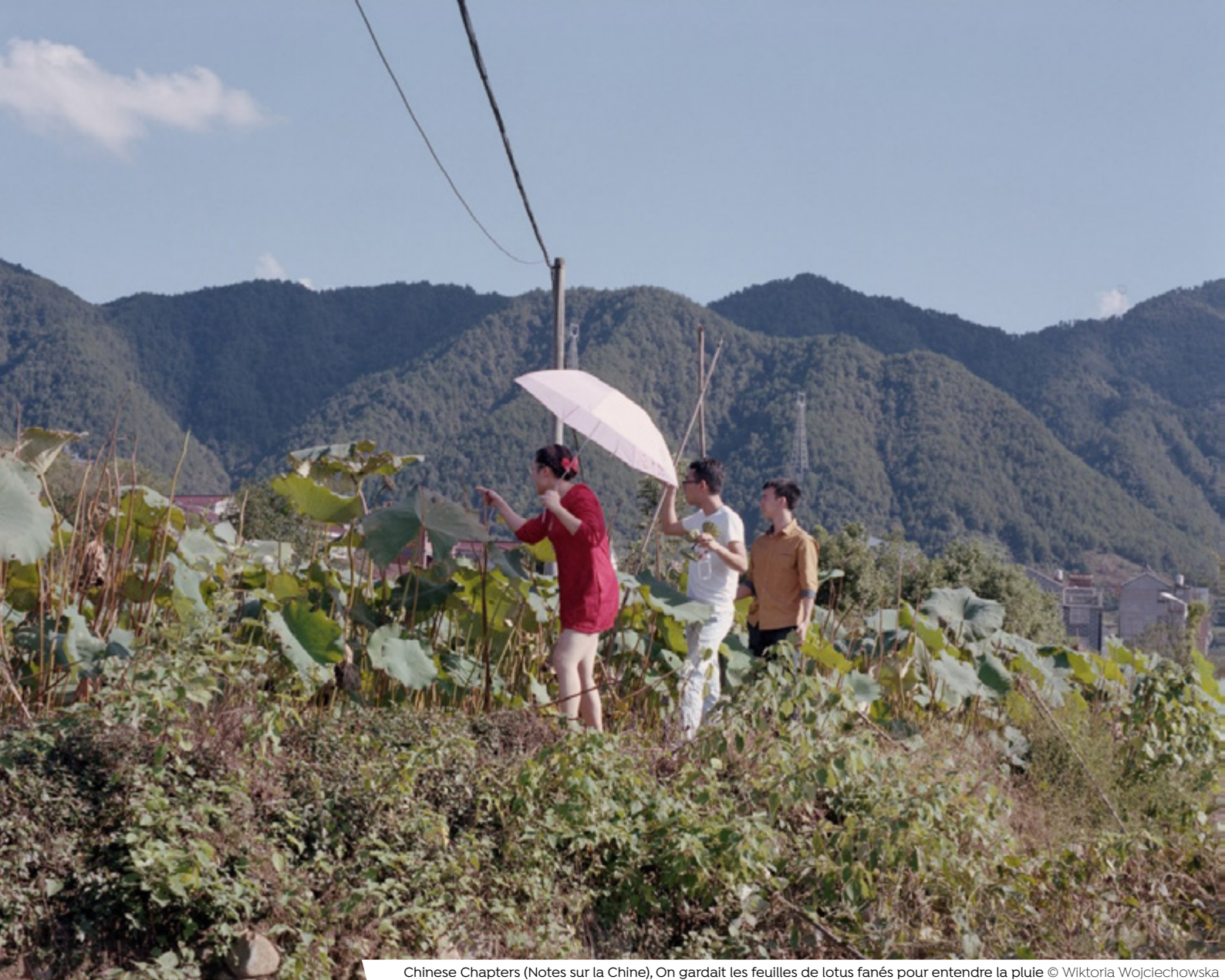
Chinese Chapters (Notes sur la Chine), On gardait les feuilles de lotus fanés pour entendre la pluie © Wiktoria Wojciechowska