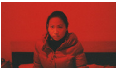
Chinese Chapters (Notes sur la Chine), Swallow : Recognition / Cōng Yàn : Reconnaissance © Wiktoria Wojciechowska

Les visuels de presse sont en libre exploitation dans l'unique but de la promotion de l'exposition « Notes sur la Chine » du 12 avril au 28 juillet 2019. Les visuels libres de droit doivent être légendés et crédités tel qu'indiqué dans l'iconographie. Merci de nous adresser une copie de la publication.