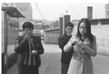
Chinese Chapters (Notes sur la Chine), Swallow : Recognition / Cōng Yàn : Reconnaissance © Wiktoria Wojciechowska