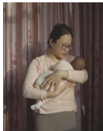
Chinese Chapters (Notes sur la Chine), Swallow : Awaiting / Cōng Yàn : L'attente © Wiktoria Wojciechowska