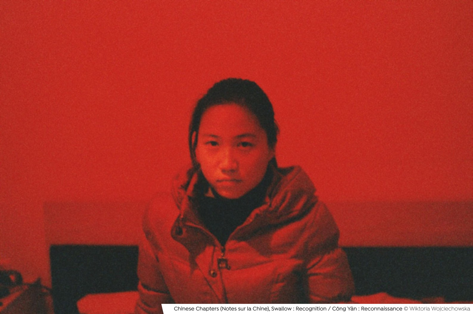
Chinese Chapters (Notes sur la Chine), Swallow : Recognition / Cōng Yàn : Reconnaissance © Wiktoria Wojciechowska