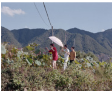
Chinese Chapters (Notes sur la Chine), On gardait les feuilles de lotus fanés pour entendre la pluie