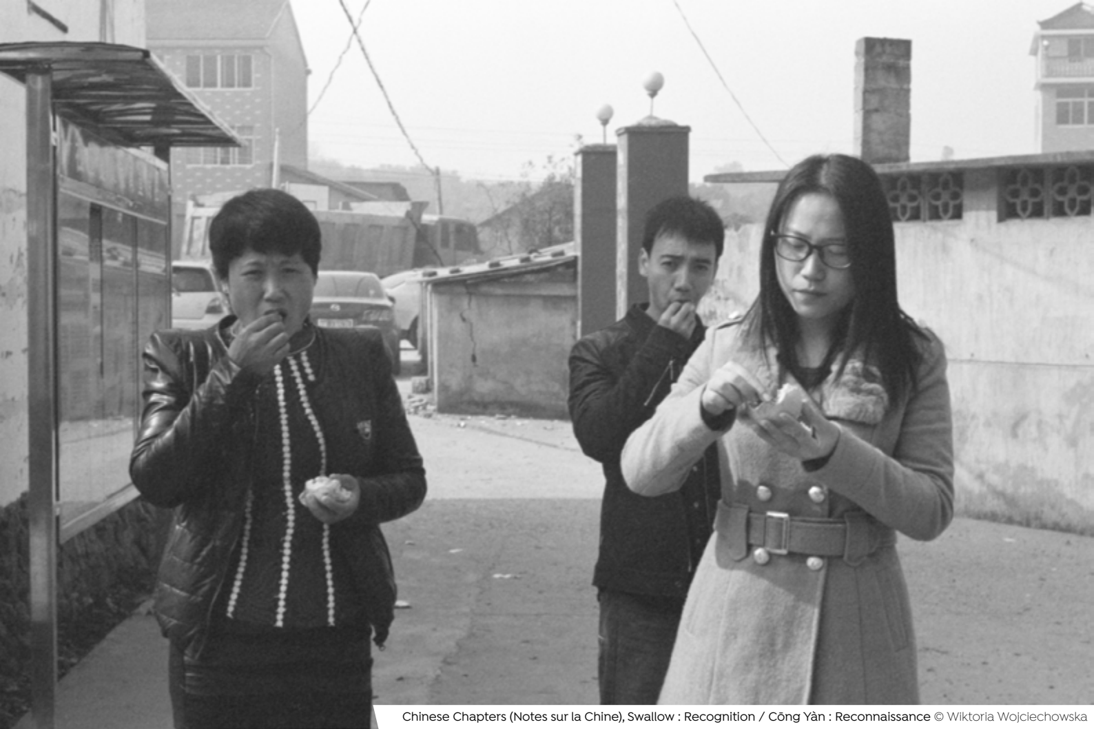
Chinese Chapters (Notes sur la Chine), Swallow : Recognition / Cōng Yàn : Reconnaissance © Wiktoria Wojciechowska